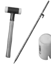
Zubehör & Nützliches

Mehr Informationen finden Sie im Internet: