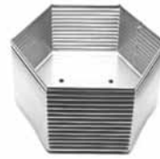
NiroTöpfe rund, 6-eckig, 8-eckig